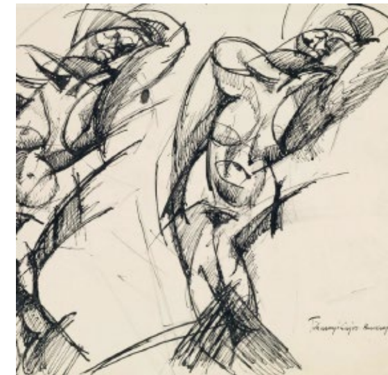
Lajos Tihanyi: Zwei Akte, 1913, Historisches Museum Nógrád, Salgótarján

Es werden nicht nur an den Pariser Privatakadmiem entstandene Aktzeichnungen der sich in Budapest zusammengefundene acht Künstler, sondern auch Vorstudien zu mehrfigurigen Szenen und Kompositionsskizzen monumentaler Werke gezeigt, die durch Tuschezeichnungen und Kupferstiche ergänzt werden, die zum Teil in zeitgenössischen Kunst- und Literaturzeitschriften erschienen und von hohem eigenem künstlerischem Rang sind. Neben den klassisierenden und primitivistischen Männerakten von Kernstock, den sinnlichen weiblichen Akten von Márffy und den expressiven Aktszenen von Tihanyi, werden sicherlich die Leihgaben aus den USA Highlights der Ausstellung darstellen, von denen mehrere Róbert Berény 1907/1908 im Pariser Salon des Indépendants in einem Saal mit den Fauves ausstellen konnte.